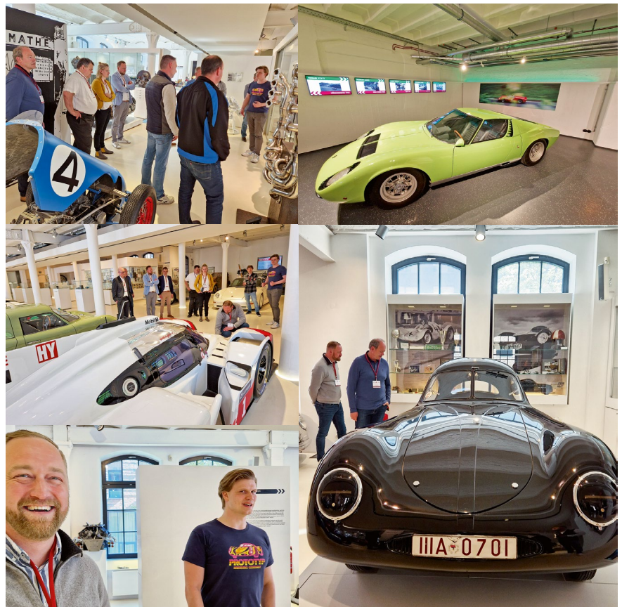
Das Automuseum Prototyp ist bekannt für seine seltenen Porsche-Modelle, hat aber darüber hinaus weitere sehr sehenswerte Exponate aus der Welt des Motorsports zu bieten.