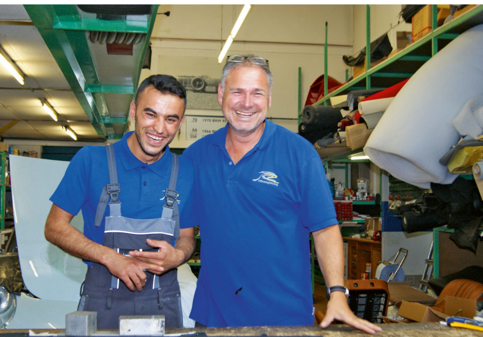
Fairness und ein guter Umgangston sind vielen Auszubildenden besonders wichtig.

Fachkräftemangel | Wie beliebt ein Beruf bei Auszubildenden ist, hängt nicht zuletzt von seinem Image bei Jugendlichen ab. Dass sich das Ansehen eines Berufes im Laufe der Zeit ändern kann, zeigen die Autoberufe.