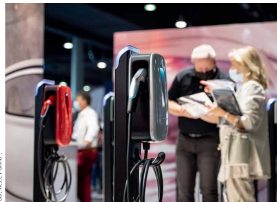
Alternative Antriebe und E-Mobilität werden künftig eine noch größere Rolle spielen.

Auf der Sonderschau „Innovation4Mobility“ in Halle 3.0 können sich die Fachbesucher über Lösungen für vernetzte Fahrzeuge und eine klimaneutrale Mobilität informieren. Experten der Unternehmen Audi, Adobe, ABB Deutschland, Bosch, BPW Bergische Achsen, Boston Consulting Group, Ebay, Google Cloud, Keyou,