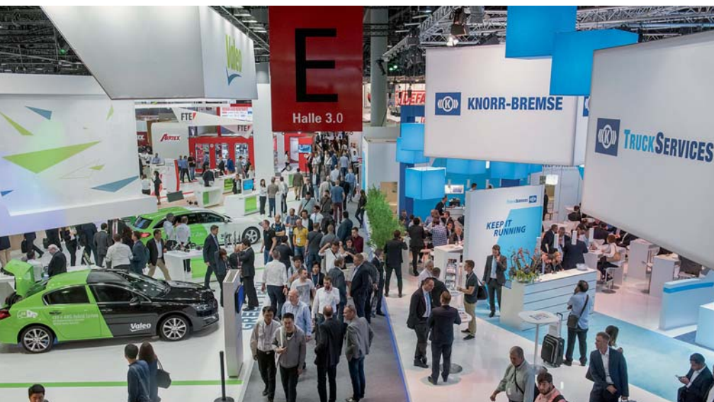
Für die Automechanika versprechen die Veranstalter wieder echtes Messe-Feeling in den Hallen.

Automechanika 2022 | Vom 13. bis 17. September zeigen 2.600 Aussteller ihre Produktneuheiten für den Aftermarket. Deutlich zahlreicher und bunter als bisher sind die neuen Angebote zur Weiterbildung und zum Networking.