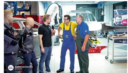
Die beiden Autodoktoren vor der Kamera beim Live-Workshop mit Wieländer + Schill.

Automechanika: https://sneak-preview-automechanika.messefrankfurt.com FabuCar: https://fabucar.de/live-workshops-2020