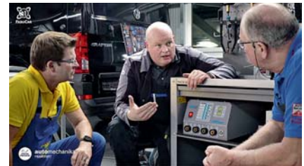
Die Karosseriearbeiten mit dem K&L-Spezialisten von Carbon fanden viele Zuschauer.

Auf den Seiten der Automechanika und von FabuCar können sich Interessierte noch kostenlos für die weiteren Workshops anmelden. Außerdem können dort die bereits ausgestrahlten Live-Workshops noch einmal angeschaut werden. diwi