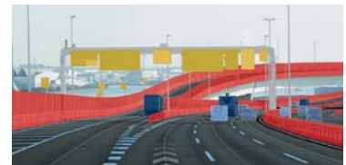
Beim autonomen Fahren ist eine neue Generation von Karten erforderlich.