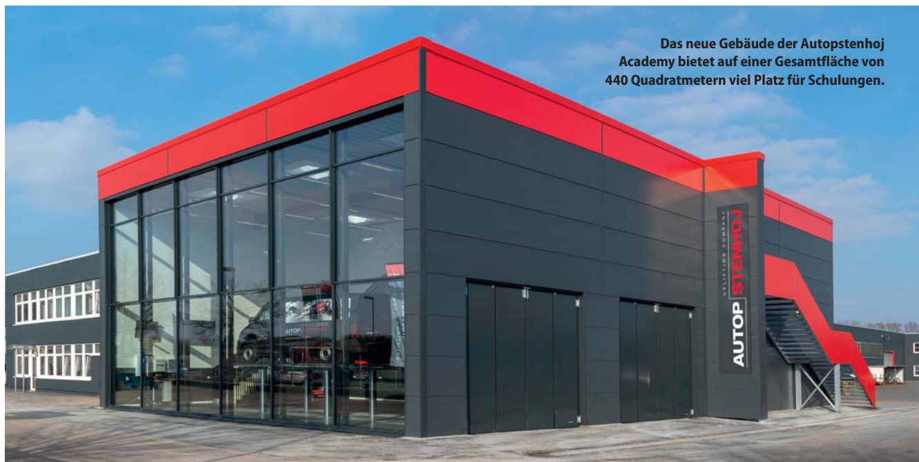
Das neue Gebäude der Autopstenhoj Academy bietet auf einer Gesamtfläche von 440 Quadratmetern viel Platz für Schulungen.

Autopstenhoj | In der neuen Academy will der Werkstattausrüster jährlich bis zu 500 Personen schulen. Dafür wurde in dem Gebäude die gesamte Produktpalette von Überflur- und Unterflurhebebühnen bis zur Prüftechnik installiert.