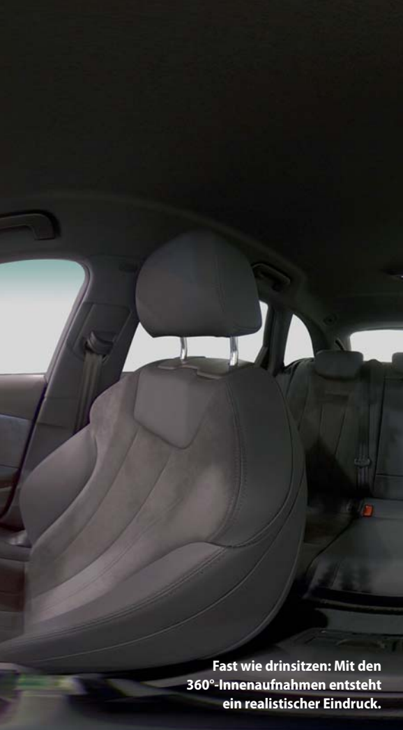
Fast wie drinsitzen: Mit den 360°-Innenaufnahmen entsteht ein realistischer Eindruck.