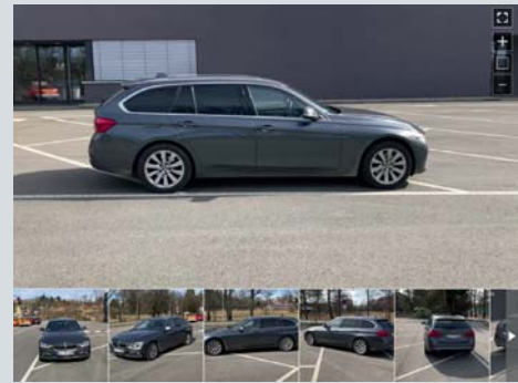
Aufnahmen aus verschiedenen Winkeln setzen sich zu einem 360°-Rundumbild zusammen.

Ospalek. Mit der digitalen Technik, die TÜV SÜD-Sachverständige auf ihrem Smartphone dabei haben, erzeugt man das gleiche Ergebnis mit viel weniger Aufwand. Notwendig ist lediglich die entsprechende App auf dem Smartphone des Sachverständigen sowie zur Erzeugung einer 360°-Innenansicht eine spezielle Innenraumkamera, die in jeden Koffer passt.