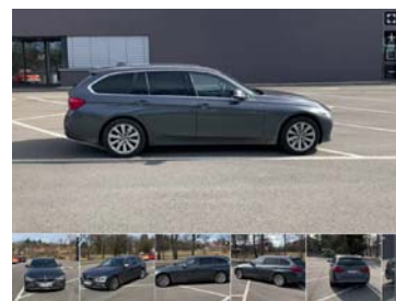
PhotoFairy 360° macht Autos aus unterschiedlichen Winkeln erlebbar.

Für die Online-Vermarktung sind aussagekräftige und professionelle Aufnahmen von Fahrzeugen heutzutage ein „Muss“. Mit der Dienstleistung TÜV SÜD PhotoFairy kann die Vermarktung deutlich optimiert werden. Fotos aus unterschiedlichen Quellen werden schnell und problemlos bearbeitet und vereinheitlicht – auf Wunsch im Corporate Design des Auftraggebers. Die professionelle Fotobearbeitung erfolgt in der Regel innerhalb von 24 Stunden. Hintergründe und Logos lassen sich anpassen und auch die Verarbeitung größerer Fotomengen ist umsetzbar. Neu ist die Erstellung von 360°-Aufnahmen für den Innen- und Außenbereich der Fahrzeuge. Gebrauchtwagen werden für potenzielle Käufer damit noch besser erlebbar, und die Verkaufsaussichten steigen. Der Endkunde bekommt hochauflösende und interaktiv steuerbare Fotos des Fahrzeugs aus jedem Winkel. Es werden weniger als zwei Minuten für die 360°-Aufnahmen benötigt. Der Mitarbeiter von TÜV SÜD läuft mit der PhotoFairy-App auf dem Smartphone einfach kreisförmig um das Fahrzeug, und die 360°-Aufnahme ist „im Kasten“. Die verschiedenen Perspektiven der Fahrzeuge ergeben eine interaktive 360°-Außenansicht. Weitere Infos zu den Möglichkeiten unter www.tuev-sued.de/photofairy