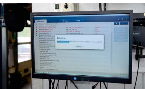
Der automatische Autoscan prüft innerhalb weniger Minuten die Steuergeräte.