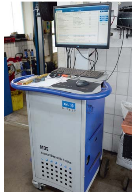
Wichtige Funktion: Der Autoscan, der nach der Fahrzeugauswahl gestartet wird.

Manchmal kommt aber selbst der Diagnosetester an seine Grenzen. Dann müssen seine Kollegen von zwei benachbarten Werkstätten herhalten. „Das A und O ist, dass ich weiß, wen ich fragen kann und von wem ich eine ehrliche Antwort erhalte“, weiß der Kfz-Meister. „Und wir drei haben ein sehr gutes Verhältnis und tauschen uns über Problemfälle aus.“ Doch nicht nur das, manchmal werden selbst die Diagnosegeräte kurzerhand ausge-