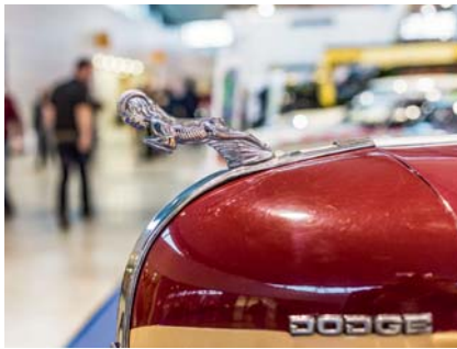
Fundgrube für historische Autoteile: In Halle 9 stellen die Teilehändler aus.