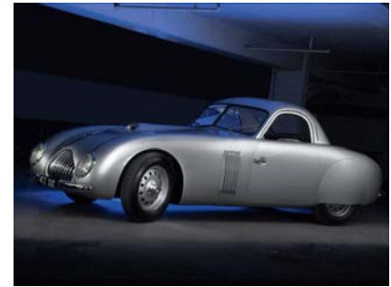
Als besonderes Highlight gilt die Sonderschau zur historischen Rennsport-Marke Veritas.

Sport- und Rennwagenbau nahm im März 1947 den Betrieb auf. Der Firmenname entstand spontan bei der Verhandlung mit der damals französischen Besatzung. Ihren ersten großen und öffentlich angekündigten Auftritt hatte die neue Marke beim Rennen auf dem Hockenheimring im Jahre 1948. Das Rennen endete mit Siegen in der Klasse der Sportwagen bis 2 Liter und von Meier in der Kategorie für formelfreie Rennwagen. Nach weiteren Erfolgen entwickelte sich ‚Veritas‘ schnell zur dominierenden Marke bei deutschen Rennveranstaltungen der frühen Nachkriegszeit. Veritas-Rennwagen waren während der 1950er-Jahre auf allen Rennstrecken Europas und darüber hinaus vertreten. Um auch zahlungskräftige Kunden anzusprechen, die nicht an Renneinsätzen interessiert waren, wurde vom Modell RS ein in der Leistung etwas gedrosseltes, für den Alltagsverkehr geeignetes Coupé abgeleitet. Das unter der Bezeichnung Comet angebotene Modell war zu seiner Zeit das teuerste deutsche Serienautomobil. Allerdings wurden lediglich etwa acht Stück hergestellt.