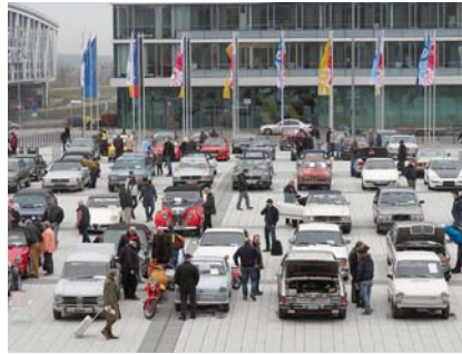
In ihrem natürlichen Element: Auch auf dem Freigelände werden Fahrzeuge präsentiert.