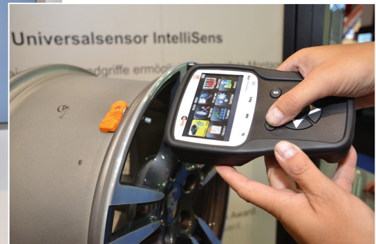
Allgegenwärtiges Thema RDKS: Vorführungen an den Messeständen von Continental (links) und Huf (oben)

D ie Zahl der Aussteller bedeutet einen Rekord, die Zahl der Besucher nicht: Die Automechanika, auf der 4.631 Aussteller aus 71 Ländern vertreten waren, schloss mit ca. 140.000 Besuchern aus 173 Ländern – rund 8.000 weniger als bei der Automechanika 2012. Laut Messe Frankfurt stieg die Zahl der Besucher aus dem Ausland um fünf Prozentpunkte auf ca. 60 Prozent. Immerhin