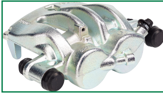
Für rund 2.000 Modelle von 55 Herstellern: aufgearbeitete Bremsättel von Brembo