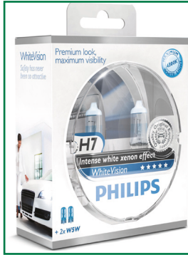
Mit weißem, Xenon-ähnlichen Lichteffect: Scheinwerferlampe White Vision von Philips