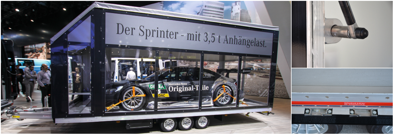
Im Bild links der Fit-Zel Uni Trans mit Plexiglasaufbau auf der IAA Nfz, die Bilder rechts zeigen Details des auf der Automechanika ausgestellten Euro Trans mit Aluminiumaufbau.

sollen, wollen die Italiener eine Marktabdeckung von 95 Prozent erreichen.