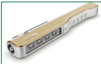
Schmuckstück: Handlampe Penlight Premium 100 Years Limited Edition von Philips