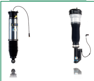
B4 und B6: Bilstein liefert Luftfedermodule für immer mehr Pkw-Baureihen