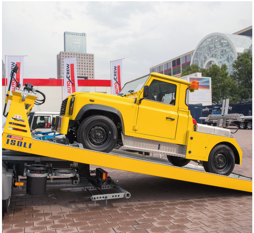
Auf das Sonderthema „Truck Competence“ weisen orangefarbene Piktogramme hin.

Was gibt es noch an Besonderheiten auf der Automechanik 2014? Laut Messe Frankfurt kehrten einige Autoreparaturlackhersteller zur Branchenmesse zurück. Konkret sind Cromax (vormals DuPont Refinish), Glasurit, Spies Hecker und Standox in Frankfurt vertreten. Und in der Halle 4 gibt es nicht nur die Club-sportarena, sondern auch substantielle Informationen, nämlich zu Folierungen, Car-Infotainment-Technologien und 3D-Druck (Rapid Prototyping). Peter Diehl