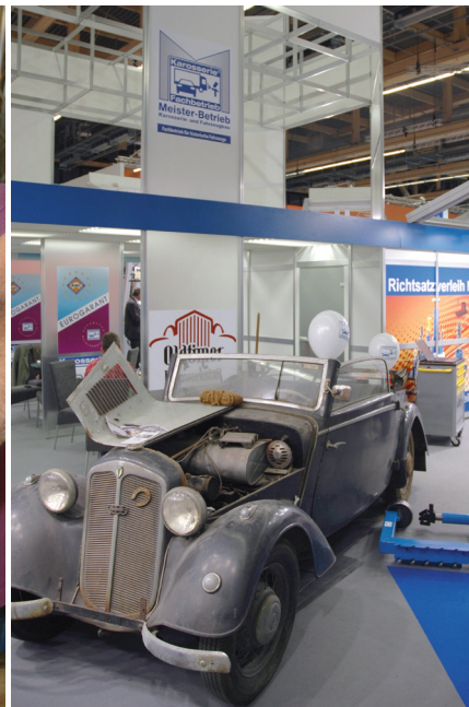
Um Service, Reparatur und Restaurierung von automobilen Klassikern geht es auf der Sonderschau „Wir können Oldtimer“, organisiert vom ZDK.

schadeninstandsetzung abgedeckt“, kündigt die Messe Frankfurt an. Die Workshops dauern jeweils rund drei Stunden und sind kostenlos. Allerdings ist eine vorherige Anmeldung nötig. Das Formular hierfür ist im Internet unter training.automechanika.com hinterlegt.