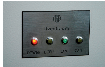
Die Funktion des ASA-Livestreams wird am Schaltschrank des Prüfstandes angezeigt

Dies ist hilfreich, wenn eine Werkstatt den Auftrag erhält ein Fahrzeug fit für die HU zu machen. Wer auf diese Möglichkeit verzichten möchte, kann den