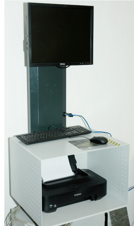
Um die Daten der Bremsprüfung vollständig auszuwerten, empfiehlt AHS einen PC mit Prüfstandssoftware Picaro III

Prüfstands-PC auch ohne die Picaro-III-Software betreiben. Dann sorgt ein spezielles ASA-Livestream-Softwaremodul lediglich für die Übergabe der Daten aus dem Prüfstand an den PC des Prüfers. Und wer es ganz puristisch wünscht, kann auch auf den PC verzichten. Dann wird lediglich eine ASA-Livestream-Box mit einem Linuxrechner installiert, welche die Daten an den PC des Prüfers übermittelt. Wirklich zu empfehlen ist der Verzicht auf den PC und die Software Picaro III nicht, denn damit beschneidet sich eine Werkstatt der Möglichkeit die Vielzahl der zu erfassenden Daten professionell zu verarbeiten. Im Zweifel müsste bei einer nicht erreichten Abbremsung die Hochrechnung zur Beurteilung der Bremsresultate von Hand erfolgen. Bernd Reich