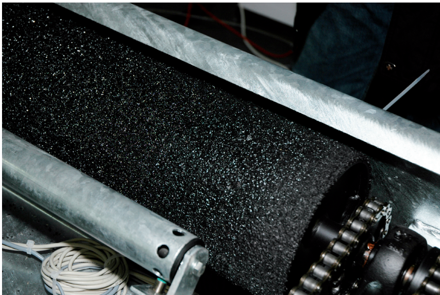
Die Prüfstandsrollen müssen einen Durchmesser von 200 mm und eine Beschichtung mit definiertem Reibwert haben

28. Juli 2010 sind nach den neuen Verfahren zu prüfen. Die Automobilhersteller müssen für jeden Fahrzeugtyp Vorgabedaten zur Verfügung stellen. Diese Vorgaben geben zum Beispiel an, wie sich die Bremskräfte zwischen Vorder- und Hinterachse verteilen müssen und wie hoch die Pedalkräfte sein dürfen. Wenn bei der Prüfung die erforderliche Bremskraft nicht erreicht wird, kann mit einer Hochrechnung anhand der Vorgabewerte festgestellt werden, ob die Abbremsung trotzdem in Ordnung ist.