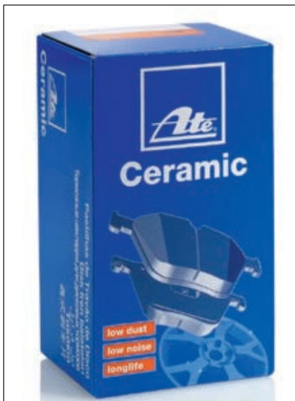
Ate-Ceramic-Bremsbeläge: kaum Bremsstaub, leiseres Bremsen damit bestückter Fahrzeuge

wieder gewährleistet“, ergänzt der Trainer. Die Ate-Honbürste erscheint geeignet, um angerostete Bohrungen zur Aufnahme von Führungshülsen bei Bremssätteln der gleichen Marke gründlich zu reinigen, was wiederum die einfache Montage und sichere Funktion der Führungshülsen ebenso wie die Beweglichkeit der Führungsbolzen gewährleistet. Nach Angabe des Anbieters ist die Ate-Honbürste mehrfach verwendbar und für die Verwendung an Führungshülsenaufnahmen verschiedener Durchmesser geeignet. Nach rund 100.000 Kilometer Fahrleistung empfiehlt man bei Ate übrigens, beim nächsten Bremsenservice auch die Führungselemente der Bremssattel zu erneuern. Weitere Exponate: das typische Ate-Angebot, bestehend aus Bremsenteilen sowie Komponenten und Systemen der aktiven Sicherheit. pd