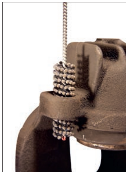
Mit einer Honbürste lassen sich die Aufnahmen von Führungshülsen gründlich reinigen

Continental; Halle 2.0, Stand B35, und Halle 8.0, Stand E08