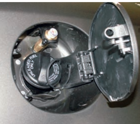
Der kleine Gaseinfüllstutzen wurde hier unauffällig direkt neben dem Benzineinfüllstutzen eingebaut

sorgfältiger Planung, zu Problemen, hat WOW ebenfalls vorgesorgt. Hier greift ein mehrstufiges Konzept. In der ersten Stufe wird zusammen mit der Werkstatt über eine Telefonhotline versucht, das Problem zu lösen.