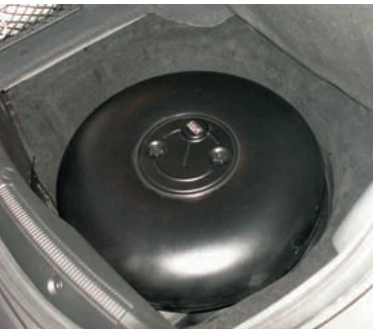
Der Einbau des LPG-Gastanks in der Reserveradmulde ist mittlerweile Standard bei Gasumrüstungen