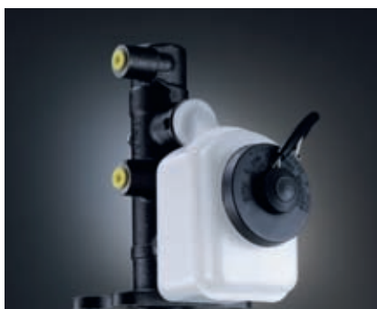
Auch Hauptbremszylinder erweitern das Programm. Sie zählen zur Produktgruppe Hydraulikkomponenten