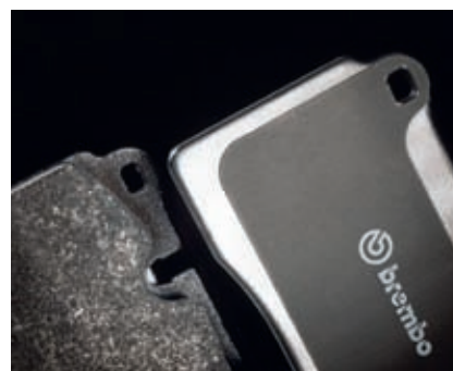
Bremsbeläge, speziell Scheibenbremsbeläge, gab es von Brembo schon früher. Neu sind Trommelbremsen-Kits