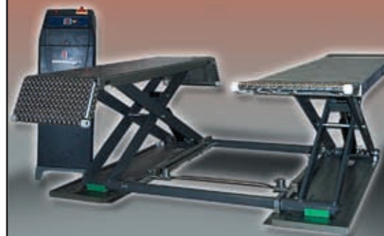
Die Panda 30*-Kurzhubhebebühne, Tragfähigkeit bis 3.000 kg, verzinkt und auch mit Mobilset lieferbar. *) Hebebühnen-Standardfarben sind Rot, Blau oder Grau.