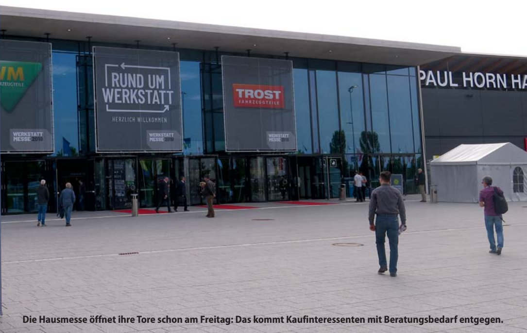
Die Hausmesse öffnet ihre Tore schon am Freitag: Das kommt Kaufinteressenten mit Beratungsbedarf entgegen.