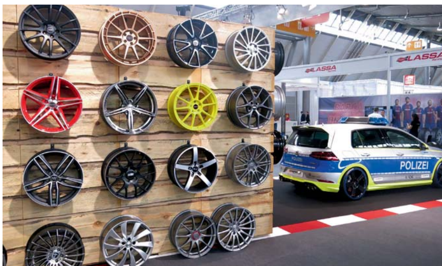
Alles zum Thema Räder und Reifen gab es in der Räder-Themenwelt.