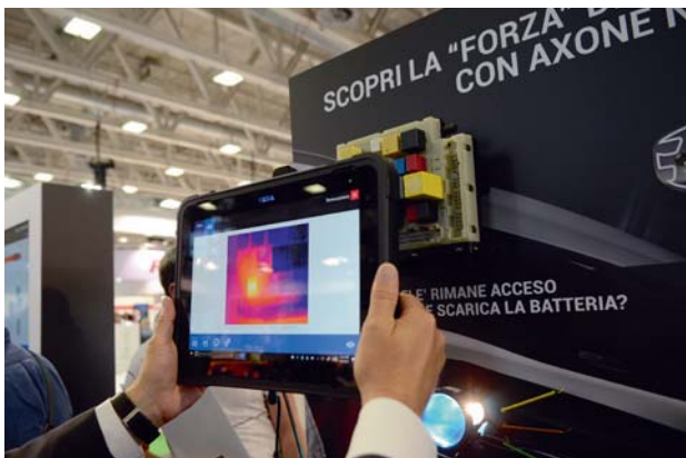
Erstmals zeigte Texa das neue Diagnose-Thermomodul für den Axone Nemo. Damit lassen sich kontaktfrei Wärmeunterschiede anzeigen.