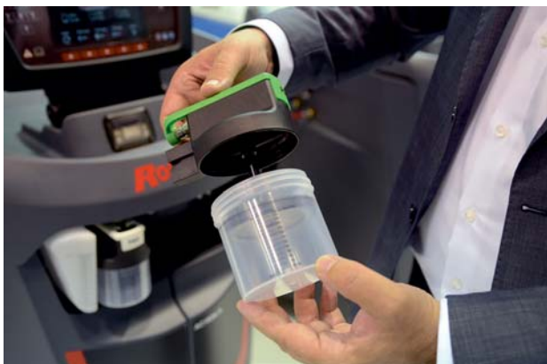
Die neuen Robinair Klimaservicegeräte verfügen über Ölbehälter, die dank speziellem Verschluss besonders dicht sind.