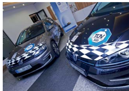
Die beiden Elektro-Fahrzeuge sind zu deutlich reduzierten Betriebskosten unterwegs.