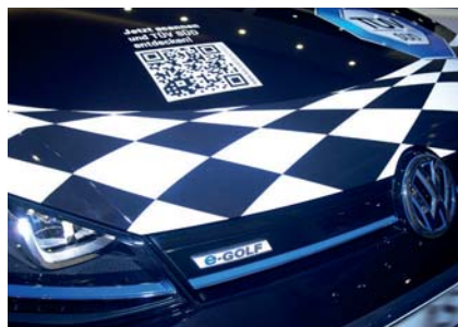
Die beiden E-Golf bringen die Sachverständigen im täglichen Prüfgeschäft zum Kunden.

kalen CO 2 - und NO x -Ausstoß. Die zahlreichen E-Tankstellen der Feser Gruppe garantieren, dass TÜV SÜD mit den E-Golf in der Region mobil bleibt. „Die Investition in die entsprechende Lade-Infrastruktur ist eine wesentliche Voraussetzung für den alltagstauglichen Betrieb unserer E-Fahrzeuge. Wir freuen uns, dass unser Partner TÜV SÜD auch auf diese Zu-