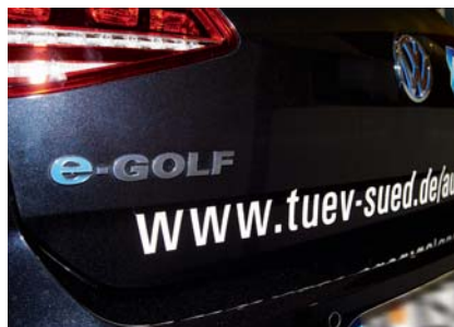
Das Projekt soll das Thema E-Mobilität auch ins Bewusstsein der Öffentlichkeit rücken.