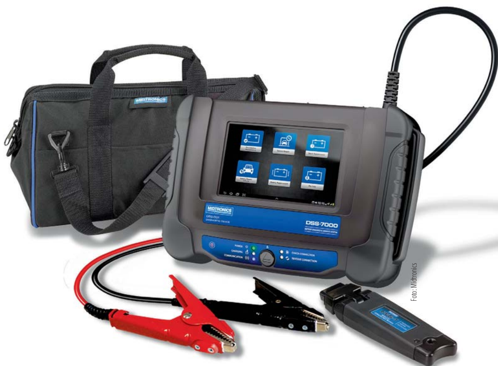
Das DSS-7000 ist das Herzstück des neuen Midtronics Diagnose und Wartungssystems. Die Apps sind für den Teilehandel und die Werkstatt nützlich.

Herzstück des Systems ist das Diagnostool DSS-7000. Das Tool ermöglicht durch eine kameragestützte Erfassung der Fahrzeug-VIN auf wichtige fahrzeugspezifische Daten zuzugreifen und umfassende Informationen zum Wartungsverlauf abzufragen. Die Kommunikation mit dem Fahrzeug erfolgt über den OBD-II-Anschluss oder durch manuelle Dateneingabe über die Tastatur. Neu sind die Batteriemangement-Apps. Hier bietet Midtronics spezielle Apps für die Werkstatt und solche für den Teilehandel. Die Werkstatt-Apps, wie „Präventivwartung“, „Rückgabe zur Wartung“, „Batteriewechsel“, „Chargenmanagement“, „PDI - Fahrzeug zum Händler“ oder „PDI - Fahrzeug zum Kunden“ automatisieren vor allem Prüfungsvorgänge. Sie helfen aber auch bei der Fehlerbehebung, erleichtern Anlernvorgänge, unterstützen die Wartung von Neuwagenbatterien oder stellen sicher, dass Batterien in Neufahr-