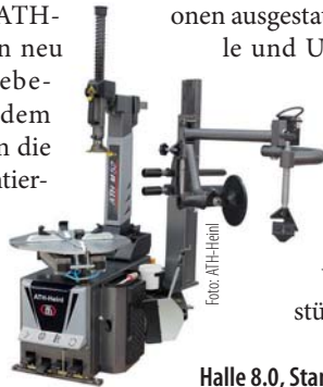
Halle 8.0, Stand A 41