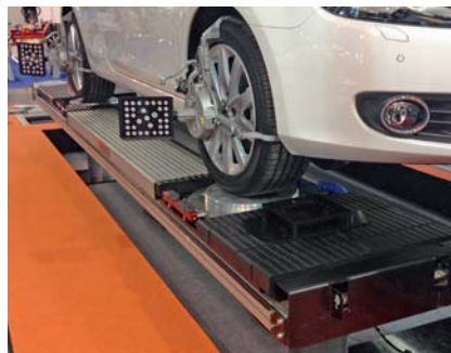
Durch diese reibungslose Luftlagerung können moderne Fahrwerke hochpräzise vermessen werden.