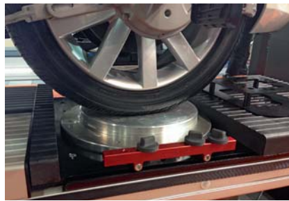
Zum Auf- beziehungsweise Überfahren werden die Dreh-Schiebeteller mittels Vakuum kraftschlüssig fixiert.