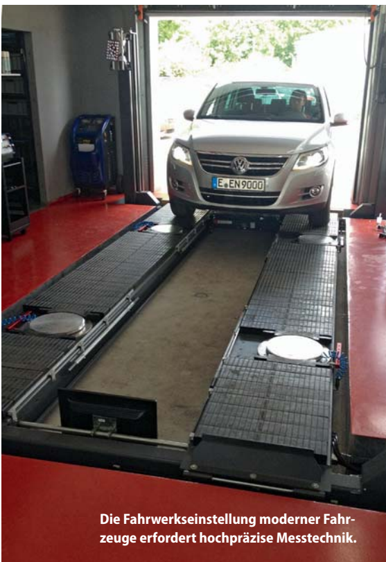
Die Fahrwerkseinstellung moderner Fahrzeuge erfordert hochpräzise Messtechnik.