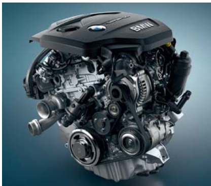
Downsizing: Das Drei-Zylinder-Triebwerk leistet 116 PS.

Ein weiteres Schmankerl findet sich direkt im Sichtbereich des Fahrers: Das optional erhältliche Head-Up-Display fährt bei Beginn der Spritztour aus dem Armaturenbrett heraus und projiziert relevante Infos wie Geschwindigkeit, Warnmeldungen oder Navigationsanweisungen in das Blickfeld des Fahrers. Das sieht nicht nur gut aus, sondern ist auch ein tolles Sicherheitsfeature. Alexander Junk