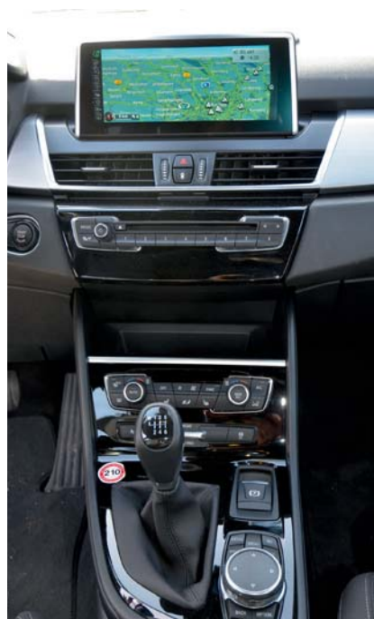
Übersichtlich: Die Armaturen sind hochwertig, das riesige Display glänzt mit hoher Auflösung.

In diese Nische passt auch der 2er Gran Tourer. Der größere Bruder des 2er Active Tourer ist ein klassischer Familienvan, der bis zu sieben Personen Platz bietet und somit eine Alternative zu VW Touran oder Ford C-Max sein soll. Wir hatten den 216d als Testwagen, der mit BMWs B37-Dieselmotor ausgestattet ist, der zur neuen Generation an Baukasten-Motoren gehört, die sich in unterschiedlichen Modellen einsetzen lassen. Dieses Triebwerk wird auch im John Cooper Works Mini und im 1er-BMW in unterschiedlichen Leistungsstufen verbaut. Der Dreizylinder-