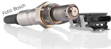
Der Stickoxidsensor misst den NOx-Gehalt im Abgas von Dieselfahrzeugen.

Moderne Autos können über 50 verschiedene Sensoren haben, darunter im Motor selbst, in der Abgasnachbehandlung und auch bei ADAS-Systemen. Wir stellen die wichtigsten vor.