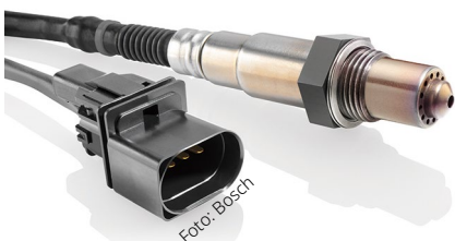
Lambdasonden messen den Sauerstoffgehalt für das optimale Kraftstoff-Luft-Gemisch.

Im Motor zeigen Kurbelwellendrehzahlsensoren die Drehzahl und Stellung der Kurbelwelle an. Mit diesen Daten ermittelt das Motorsteuergerät den genauen Einspritz- und Zündzeitpunkt. Nockenwellensensoren erfassen die Stellung der Nockenwelle. Dadurch sind eine hohe Messgenauigkeit und ein exakter Einspritz- und Zündzeitpunkt für die Motorsteuerung möglich. Nockenwellensensoren können auch erkennen, wenn die Steuerkette gelängt ist und die Synchronisation der Motorteile aus dem Takt