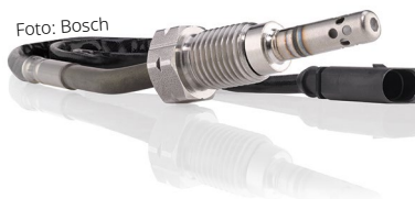
Abgastemperatursensoren kommen an verschiedenen Stellen zum Einsatz.

In der Abgasnachbehandlung nehmen Sensoren einen wichtigen Stellenwert ein, damit die Emissionswerte im Zaum gehalten werden. Sehr bekannt sind Lambdasonden, die den Sauerstoffgehalt im Abgas messen und notwendige Informationen für das optimale Luft-Kraftstoff-Gemisch an das Motorsteuer-