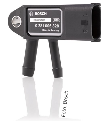
Differenzdrucksensoren überwachen den Differenzdruck des Partikelfilters.

für verschiedene Hydraulik-Anwendungen. Verwandt mit den Railldrucksensoren sind Öldruck- und Kraftstoffdrucksensoren. Diese Sensoren sorgen für die schnelle und genaue Messung des Kraftstoff- und Öldrucks in niederen und mittleren Druckbereichen in allen Arten von Verbrennungsmotoren. Darunter sind neben Diesel- und Ottomotoren auch Gasfahrzeuge mit CNG und LPG gemeint. Manche Versionen dieser Sensoren enthalten zusätzlich einen integrierten Temperatursensor.